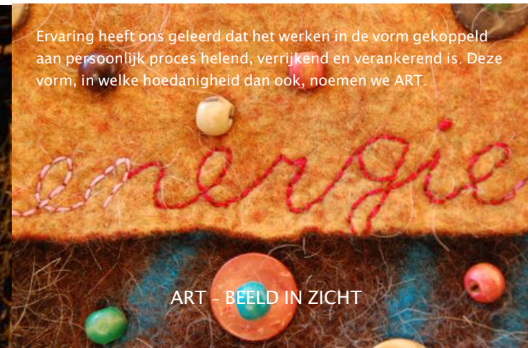
ART - BEELD IN ZICHT

Gedurende het kernprogramma zal de aandacht steeds verder verschuiven van het client zijn naar therapeut worden (zie hiervoor ook studietraject en studietijd). Je oefent tijdens je opleidingstweedaagsen en in de thuiswerkgroepen die 1x per maand plaatsvinden.