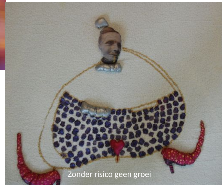
Zonder risico geen groei

Beeld/ vorm (in de zin van beeldend werk, dans, zang, muziek, poëzie, gedicht, sprookjes, dromen, verhalen, lichaamswerk enz.) heeft een belangrijke plaats in het kernprogramma. Je leert de kracht van beelden kennen, lezen en te gebruiken, zowel persoonlijk als in contact met je cliënten. In beeld zitten veel contact- en groeimogelijkheden. Beeld loopt voor op je bewustzijn en brengt dus altijd iets wat voor jou nog niet zichtbaar is. Beeld is een echte cadeau-brenger als het over bewustzijn gaat. Beeld brengt je in verbinding met je hart, met het zelf, met je authenticiteit. Het werken in een creatieve vorm/ jouw vorm, ontwikkel je (verder) tijdens de opleiding.